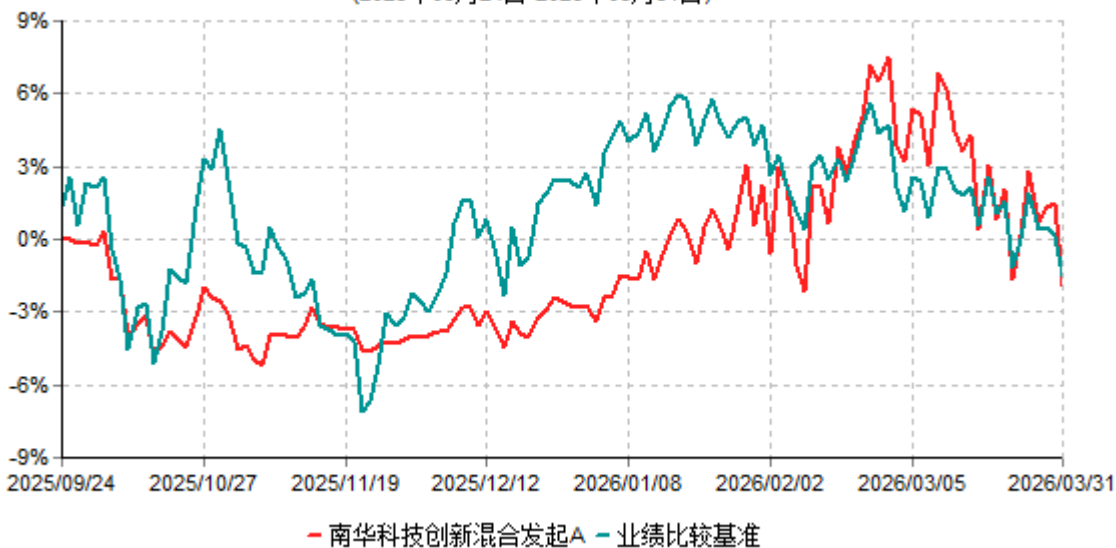
南华科技创新混合发起A累计净值增长率与业绩比较基准收益率历史走势对比图 (2025年09月24日-2026年03月31日)