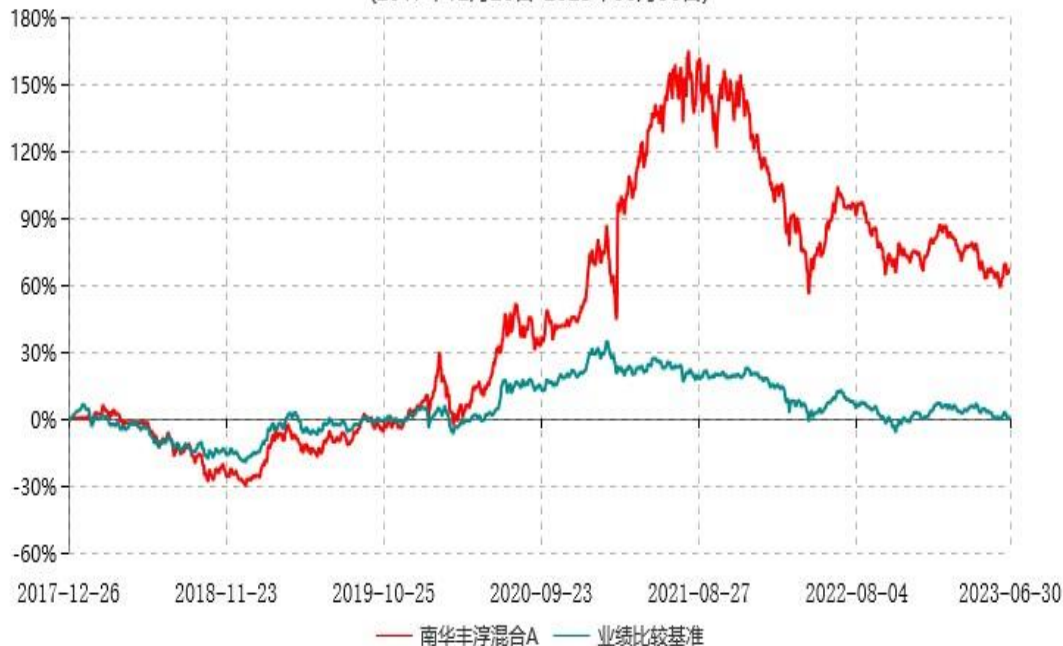
南华丰淳混合C累计净值增长率与业绩比较基准收益率历史走势对比图